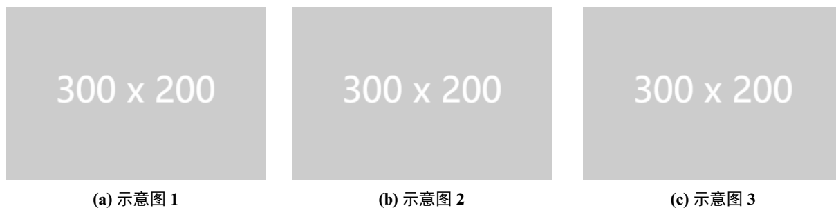
图 2 一行三张子图并排示意